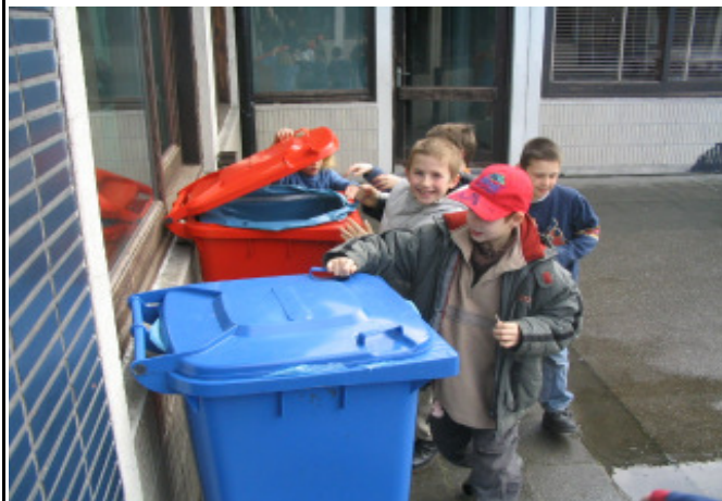
Net voor Jeff aankwam werd de speelplaats piekfijn opgeruimd