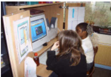
De computerhoek is de hoek bij uitstek, alle leerlingen zijn enorm gebrand om in deze hoek te kunnen werken. Via deze weg leren de kinderen werken op het internet om bijvoorbeeld informatie op te zoeken of allerlei andere educatieve spelletjes te spelen.